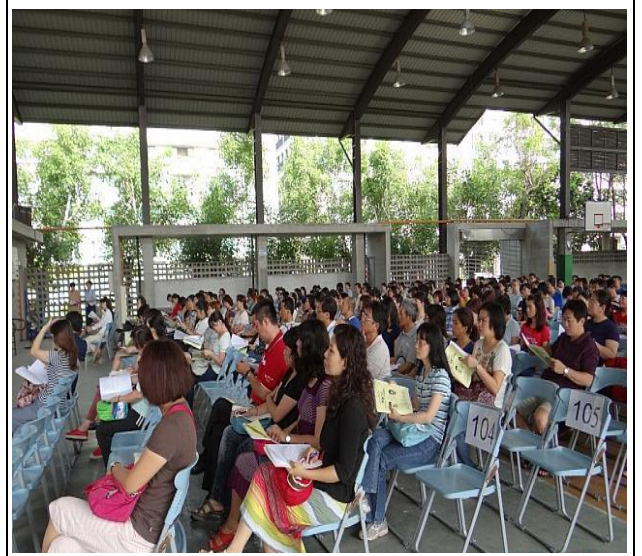
說明：班親會家長簽到