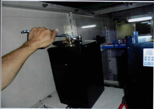
編號15：行政大樓SC改善中4