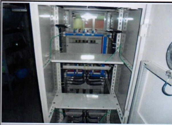
編號13：行政大樓SC改善中2