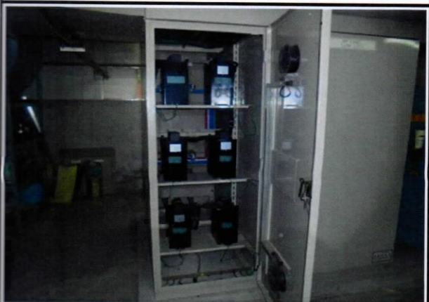
編號17：行政大樓SC改善後