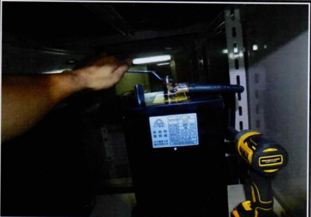
編號16：行政大樓SC改善中5