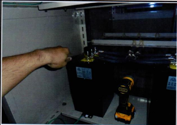
編號14：行政大樓SC改善中3