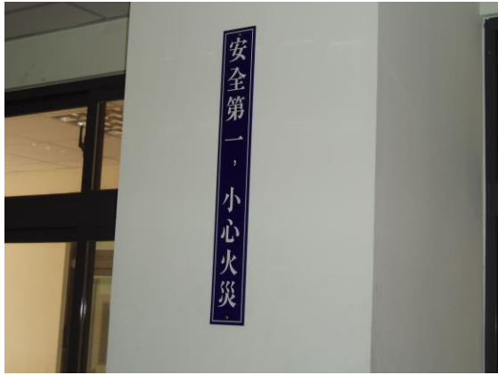
教室內設有工安警語