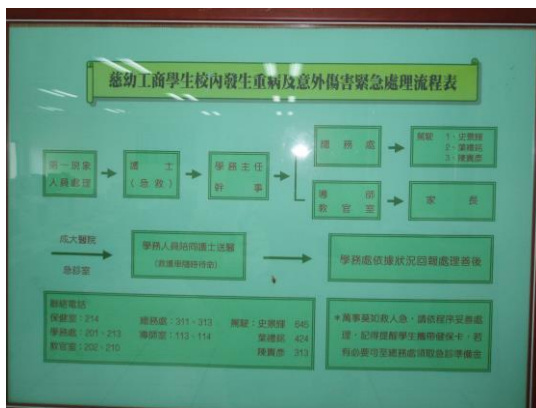
各實習教室及工廠均立有學生意外傷害緊急處理流程表，利於師生處理緊急事故