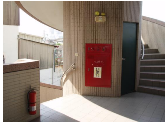
各樓層北邊上下樓梯均設消防警示與消防栓設備及滅火器