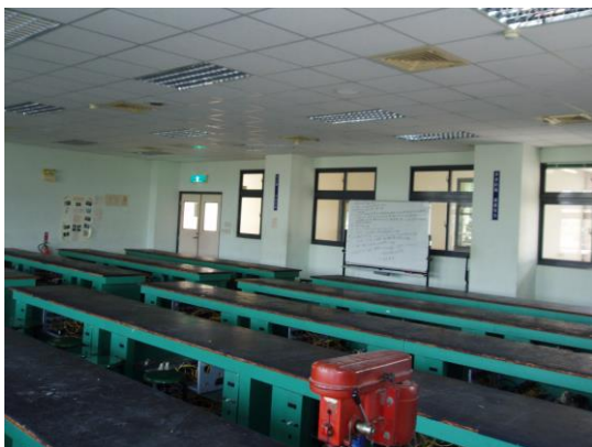
2-3 電機電子教室設有工安規則、煙霧偵測器、逃生指示燈、緊急照明設備、教室空間設計易於逃生。