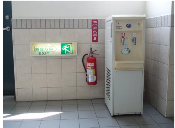
教室外設有逃生指示燈、滅火器