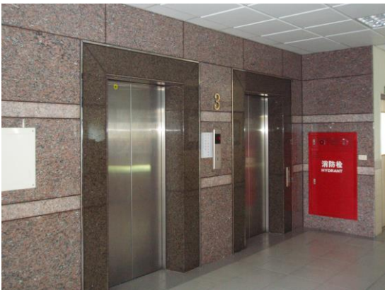
各樓層均有電梯提供行動不便師生使用外，另設有消防警示與消防栓設備