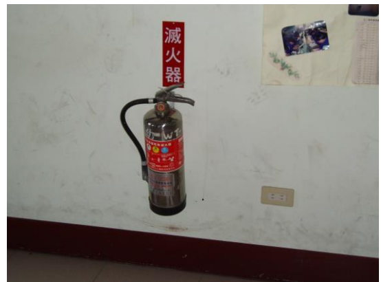
教室內設有滅火器設備