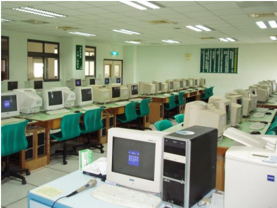
教室內設有工安規則、煙霧偵測器、逃生指示燈、教室空間設計易於逃生。